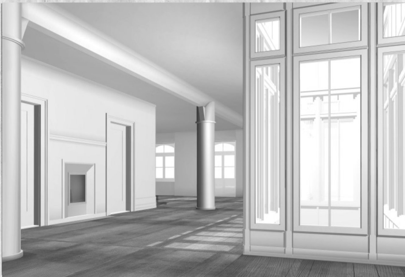
Erlebbarer Gebäudetiefe: Wohnung in der ehemaligen Fabrik Günsburger & Wolf in Kleinbasel

Dieses Konzept der Verschmelzung von Alt und Neu haben sie schon beim Lohnhof erfolgreich angewandt, an der Oetlingerstrasse ist es noch konsequenter umgesetzt. So lösen Buol & Zünd das architektonische Motiv der gemauerten Gewände, welche die Fenster fassen, aus seinem Kontext und entwickeln es weiter. Es entstehen eine vorgelagerte